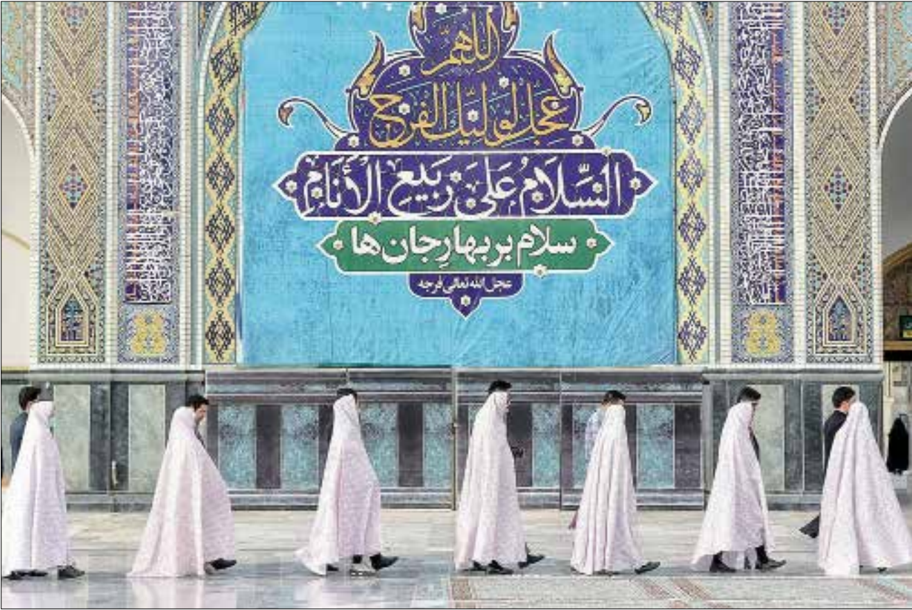
عجل الله تعالی فرجه