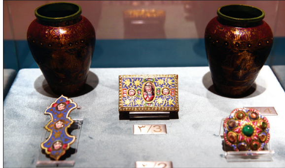
نمونه‌هایی از هنر جواهرسازی و معرق‌کاری روی فلز