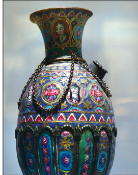
کوزه‌ای با هنر معرق روی فلز