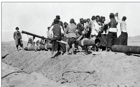
اجداد قیری تصمیم گرفتند از ماده سیاه رنگ چشمه خراسان بهره برداری کنند

مستر جی. پی. رینولدز وکیل داری، به نیابت از او متعهد شده است که در ارتباط با موضوع قرارداد، در ماه اکتبر هر سال مقدار یک هزار و پانصد من شوشتر نفت و مقدار یک هزار و پانصد من شوشتر قیر به نمایندگان سادات قیری تحویل داده و نفت و قیر استخراج شده خود را به هیچ وجه در شوشتر و دزفول نفروشد. این مقاوله نامه جاری خواهد ماند تا زمانی که امتیاز از جانب اعلی حضرت همایونی (پادشاه قاجار) به جناب فخامت نصاب مستر ویلیام ناکس داری داده شده باقی است و مستر داری را اختیار فسخ است. ناگفته نماند که این قرارداد تا سال‌های اولیه پس از سقوط پهلوی نیز مورد تأیید وزارت نفت بود و مقرری ناچیزی به سهامداران فامیل سادات قیری داده می‌شد که به مرور و با توجه به عدم وجود مدارک قضایی مستند در اثبات مالکیت زمین و .... این مقرری مشمول مرور زمان شد.