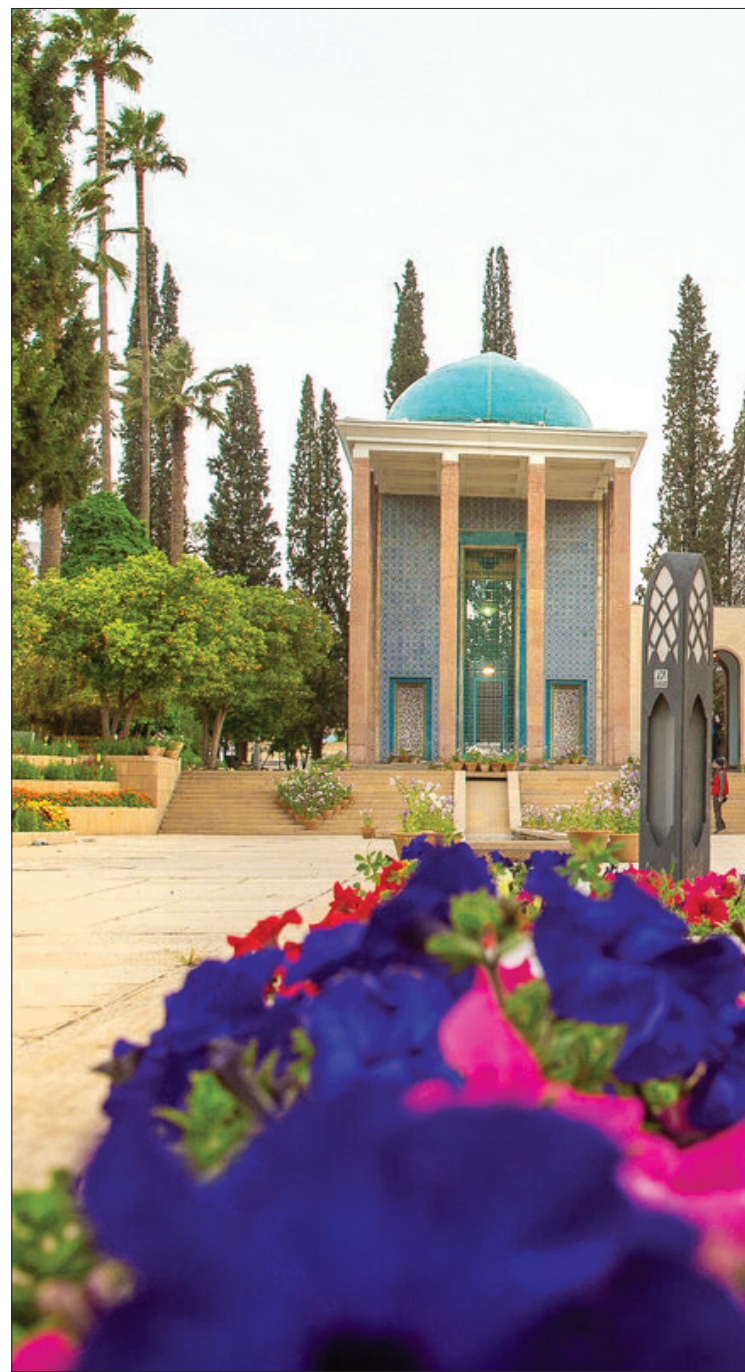
باغ خرمی که مزار سعدی را دربرگرفته، کنایه ای از جهان شعری او هم هست