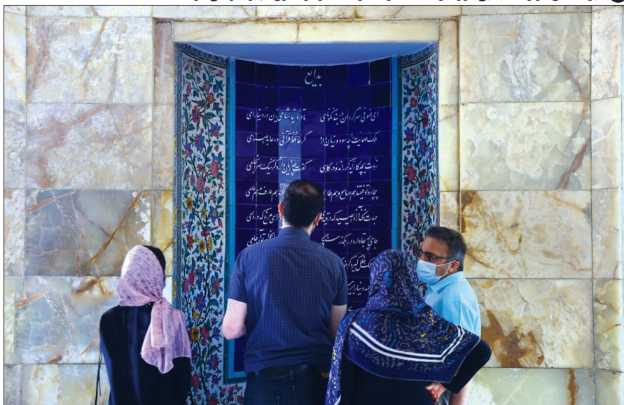
کتیبه ضلع جنوب غربی، حاوی غزلی خواندنی از سعدی است