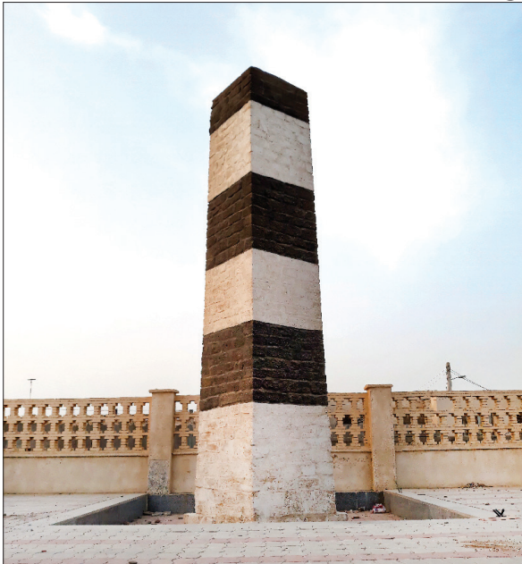
فانوس دریایی جاسک، معروف به برج سیاه و سفید