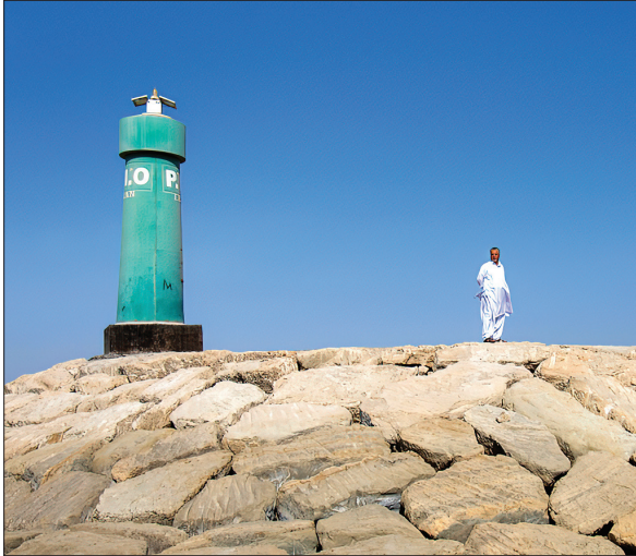
فانوس دریایی روستای یک‌بنی در نزدیکی جاسک