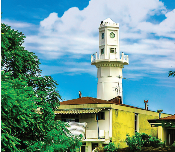
فانوس دریایی بندر انزلی؛ یکی از دو فانوس خطه شمال کشور