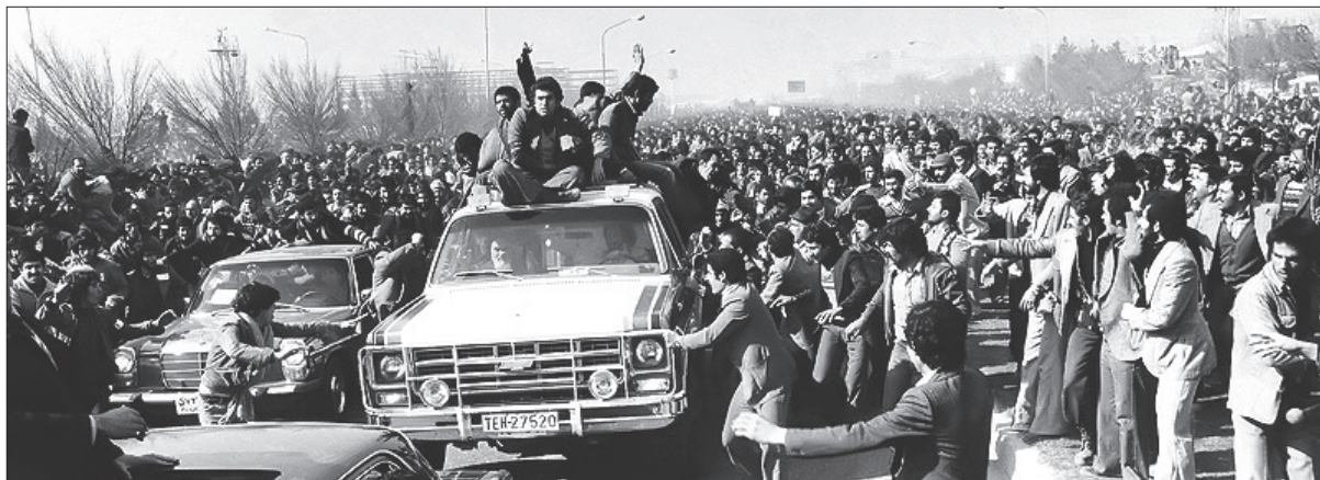
اتومبیل حامل امام(ره) در بین استقبال مردم در مسیر بهشت زهرا(س)