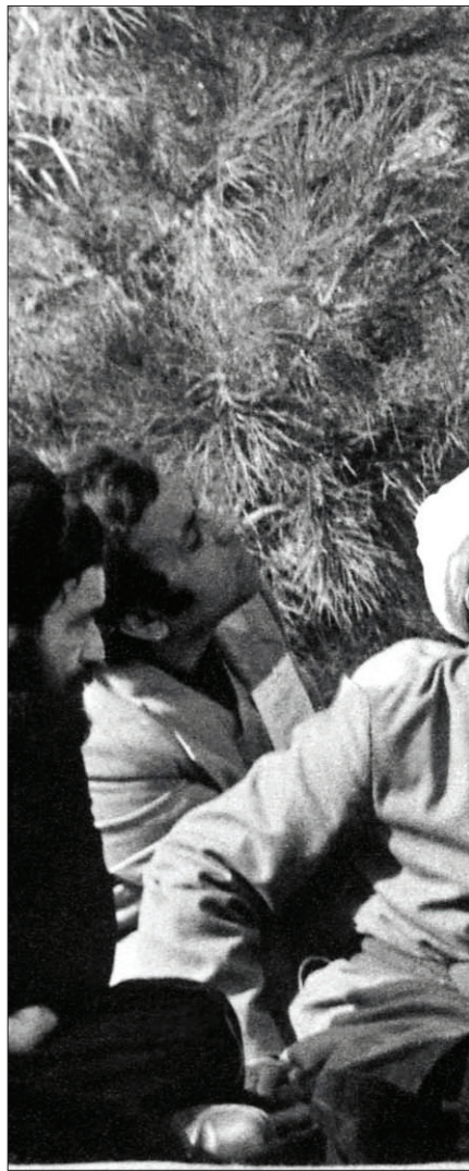
اولین سخنرانی بنیان گذار کبیر انقلاب پس از ورود به ایران در بهشت زهرا(س) و کنار مزار شهدا ایراد شد