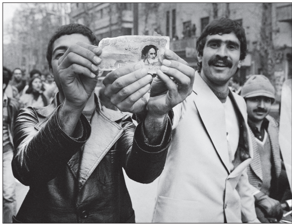
شادی های خیابانی بهمن ماه

قطعه ۱۷ بهشت زهرا(س) ماندگارترین قطعه در تاریخ انقلاب است. در نزدیکی این قطعه خودرو حامل امام(ره) از کار می افتد و عده ای از جوانان ماشین را بلند کرده و نزدیک هلیکوپتر بر زمین می گذارند