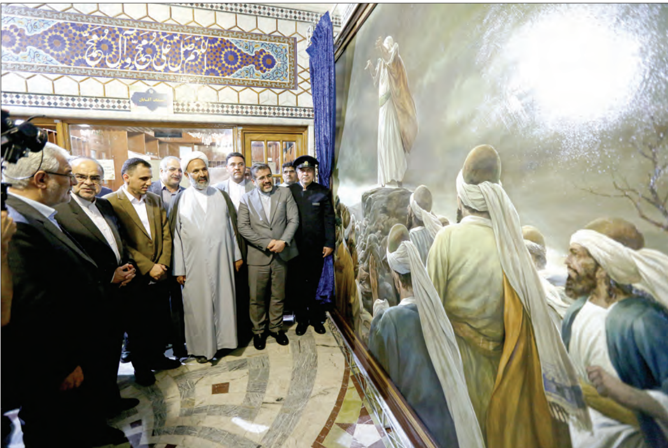
روح‌الامین در تالار قدس

اختتامیه نوزدهمین دوره جشنواره بین‌المللی امام رضا(ع) و افتتاحیه بیستمین دوره این جشنواره همزمان با سالروز میلاد حضرت رضا(ع) با حضور وزرای فرهنگ ایران و عراق در تالار قدس حرم مطهر رضوی برگزار شد.به گزارش مرکز روابط عمومی و اطلاع‌رسانی وزارت فرهنگ و ارشاد اسلامی، در اختتامیه نوزدهمین جشنواره بین‌المللی امام رضا(ع) و افتتاحیه بیستمین دوره آن که با حضور محمدمهدی اسماعیلی، وزیر فرهنگ و حسن ناظم، وزیر فرهنگ و گردشگری عراق در تالار قدس کتابخانه مرکزی آستان قدس رضوی برگزار شد، هشت خادم برگزیده فرهنگ رضوی در خارج از کشور تجلیل شدند. گفتنی است، در ابتدای این مراسم از تابلو «نماز باران» جدیدترین اثر حسن روح‌الامین رونمایی شد. همچنین تجلیل از خادمان برگزیده فرهنگ رضوی در سال ۱۴۰۱ و رونمایی از جدیدترین تولیدات بنیاد فرهنگی هنری امام رضا(ع) از جمله برنامه‌های این مراسم بود.