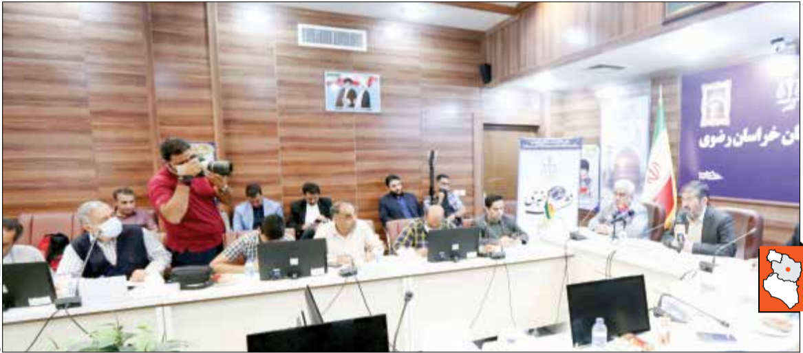
ع.ا.خ. - ع.ا.خ.

رسیدگی به اتهامات آن افراد، پرونده به تهران ارسال خواهد شد. قاضی درودی در واکنش به موضوع آزادی سارقانی که زیر ۲۰ میلیون تومان سرقت کرده باشند هم نکاتی را مطرح کرد و در این باره گفت: هیچ‌کسی این را عنوان نکرده که نباید با سارقانی که زیر ۲۰ میلیون تومان سرقت کرده برخورد شود و تحت تعقیب قرار نگیرند. اصل موضوع این است که براساس قانون اگر میزان مال مسروقه زیر ۲۰ میلیون تومان بود و سارق هم برای نخستین بار مرتکب جرم شده بود، مالک و شاکی می‌تواند پس از دریافت اموال از شکایت خود صرف‌نظر و موقوفی تعقیب در پرونده زده شود. اما این ماجرا به مجرمان سابقه‌دار ارتباطی ندارد حتی اگر آن‌ها زیر ۲۰ میلیون تومان سرقتی را رقم بزنند با رضایت شاکی بازهم آزاد نخواهند شد.