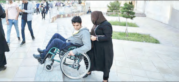
مختلف است در شهرستان مهریز تشکیل شده؛ اما امین در حالی است که هنوز ورودی برخی از دستگاه‌های اجرایی، بانک‌ها، نهادها و شرکت‌ها برای رفت و آمد سالمندان و معلولان مناسب سازی نشده

این مسئول بیان کرد: کمیته مناسب سازی معابر که متشکل از مسئولان دستگاه‌های