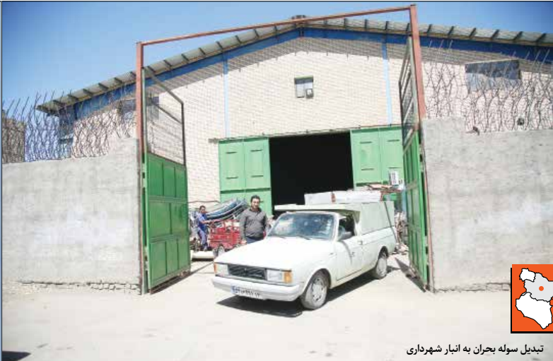
تبدیل سوله بحران به انبار شهرداری

را نمی‌توانیم جای دیگری ببریم، سوله را تاکنون تخلیه نکرده است. مقدم می‌گوید: با پیگیری‌های بیشتر ما یکی از مسئولان شهرداری در دوره گذشته با این استدلال که این ساختمان به هیچ وجه هیچ استحکام بنایی ندارد، دوباره موضوع را مسکوت گذاشت. ساختمانی که قرار بود سوله بحران شود، حالا می‌گویند استحکام بنا ندارد و مناسب سالن ورزشی نیست و پس از پافشاری‌های ما گفتند هرگز ما این سالن را به شما نمی‌دهیم. به هرکجا می‌خواهید شکایت کنید.