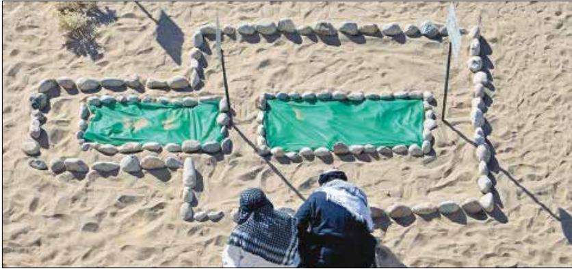
تomb of Jaber bin Abdullah (Anasari)

با وجود آنکه فعالیت‌های جابر بن عبدالله عموماً در امور علمی و دینی متمرکز بود، اما وی در دوران خلافت امیرمؤمنان(ع)درزمره اصحاب‌نزدیک‌وسربازان فداکار آن حضرت قرار گرفت؛ موضوعی که در دوره خلفای قبل، به ندرت اتفاق می‌افتاد. جابر در زمره گروهی از یاران امام علی(ع) بود که به آن‌ها «شرطه‌الخمیس» می‌گفتند؛ گروهی فداکار و از جان گذشته که برای پیشبرد اهداف حکومت عدل علوی از هیچ فداکاری‌ای دریغ نمی‌ورزیدند. جابر به دلیل همراهی با امام(ع) و دفاع از حریم ولایت از شخصیت‌های مورد اعتماد و وثوق شیعه است. او پس از شهادت امیرمؤمنان(ع) از اصحاب امام حسن(ع)، امام حسین(ع) و امام سجاد(ع) بود و پس از دیدار با امام محمدباقر(ع) در سنین نوجوانی آن حضرت، سلام‌رسول خدا(ص)را به ایشان رساند. جابر در زمان واقعه کربلا، پیرمردی نابینا