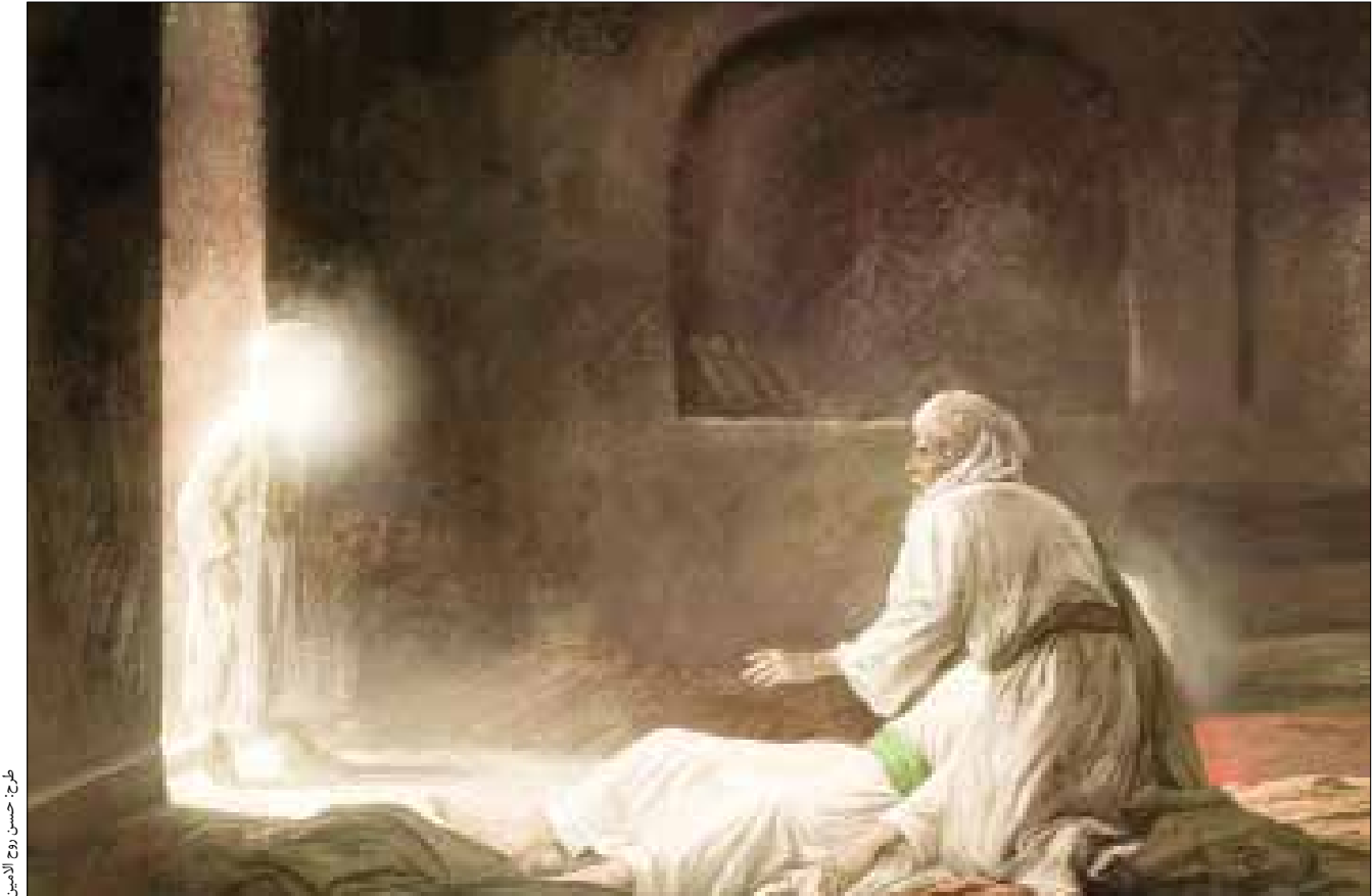
عبدالله بن محمد بن حسن بن علی بن ابی‌طالب

عرض ارادت علما و شخصیت‌های فرهنگی اهل سنت کشور به ساحت امام رضا(ع)