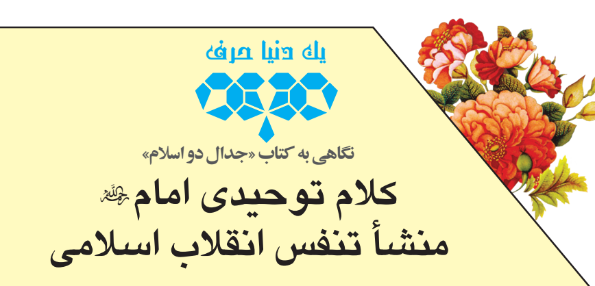
حجت‌الاسلام محسن قرآنی

نوید سوزدار ؛ بنای انقلاب اسلامی بر توحید است و برای ادامه راه حق و مبارزه، واجب است بر کلمات توحیدی تکیه داشته باشد. آن کلمات توحیدی از حلقهٔ واصلی برخاسته که مایه تذکر و خیز مردم شد. با فهم توحیدی از انقلاب، تک‌تک کلمات امام‌راحل برای حرکت در مسیر سئلاک و پیچ و خم مبارزه با فکر خشکی می‌شود. جملات امام بنا و محور با فکر خشکی می‌شود. هرمنود تمام انقلاب اسلامی را مشخص می‌کند و رهنمود تمام سال‌های پس از ۱۳۵۷ می‌شود. این جملات اسکلت و مبنای است که تکلیف مبارزه را تا زمانی که اسلام آمریکایی وجود دارد تعیین می‌کند و منشأ تنفس و زنده ماندن انقلاب اسلامی است که امام(ره) فرمود: «مردم ما علیه ظلم و تحجر قیام کردند و فکر اسلام ناب را جایگزین اسلام سلطنتی، اسلام انقطاع، اسلام سرمایه‌داری و در یک کلام اسلام آمریکایی کردند، امام(ره) اصل‌ترین نقطه در مبنای توحیدی خود را روی تقابل اسلام آمریکایی با اسلام ناب محمدی(ص) گذاشتند. مقصود امام از اسلام آمریکایی چیزی است که رسول اکرم(ص) به مقابله با آن برخاست، اسلام آمریکایی همان اسلام بی تفاوت در مقابل ظلم، زیاده‌خواهی و دست‌اندازی به حقوق مظلومان، اسلام تشکیقات و اسلام کتک به رؤوگوییان است. اسلام ناب محمدی(ص) اما درست در نقطه مقابل قرار می‌گیرد. نور تحول ایران تذکری برای عالم بود و تلنگری برای عزت جوانان. امام خمینی(ره) صدقاً «لأُمَمَاتٍ مُّذَكَّرَاتٌ» است و کلامش تأمین‌کننده سلاح مبارزه. این کلام نورانی در مجموعه‌ای به نام صفحه امام(ره) جمع آوری شده‌است، مجموعه‌ای که البته خواندنش در عین ضروری بودن، مطول است. کتاب «جدال دو اسلام» نور این گنجینه را بر گرد آوردن