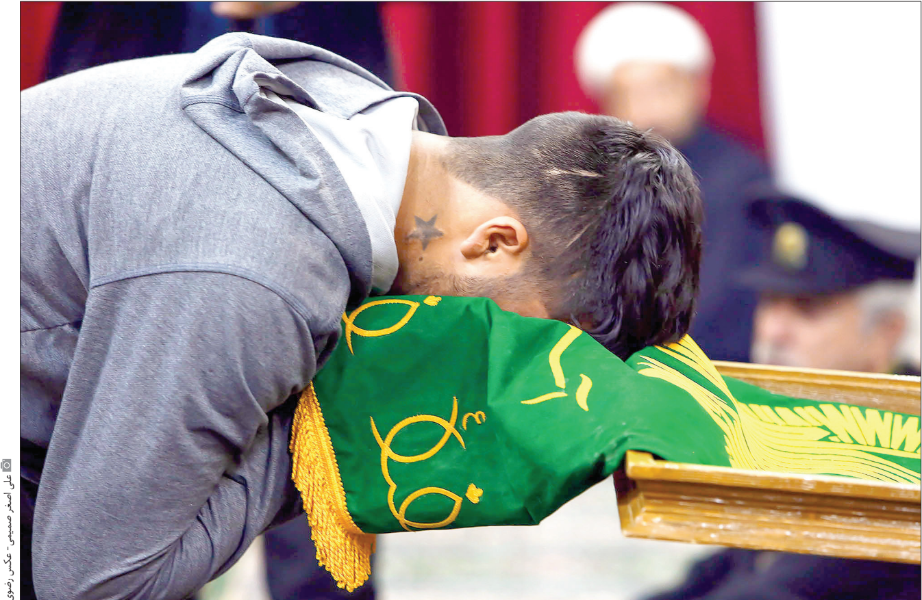
علی‌اصغر صمیمی - عکاس رضوی