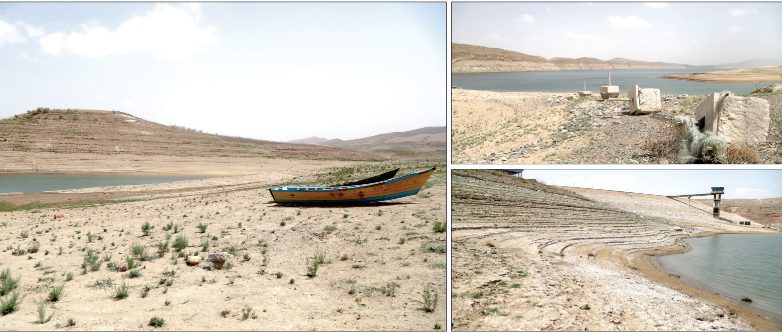
در این شهرستان

که به نصف کاهش یافته و این میزان قابل برداشت نبوده و خروجی این سد را صفر کرده است. ۸۳/۰ میلیون مترمکعب نیز میزان ورودی آب به سد طرق از ابتدای سال آبی جدید تا به امروز بوده که رقم قابل توجهی نیست. کاظم جم با بیان این مطلب که ظرفیت ذخیره سد کارده ۲۶ میلیون مترمکعب است، می‌گوید: در حال حاضر ۲ میلیون و ۲۵۰ هزار مترمکعب آب پشت این سد وجود دارد که معادل ۸ درصد ظرفیت را شامل می‌شود. با وجود اینکه ۹۱/۰ میلیون مترمکعب ورودی از ابتدای سال آبی داشته؛ اما با افت قابل توجه آب پشت سد، میزان خروجی این سد نیز صفر است. داستان برای سد ارداک نیز به همین منوال است و با ۳۰ میلیون و ۳۰۰ هزار مترمکعب گنجایشی که دارد و ۱۲ درصد حجم پرشدگی آن، با توجه به ورودی یک‌میلیون و ۷۰۰ هزار مترمکعبی که از ابتدای سال آبی داشته؛ اما خروجی سد ارداک مثل طرق و کارده صفر است.