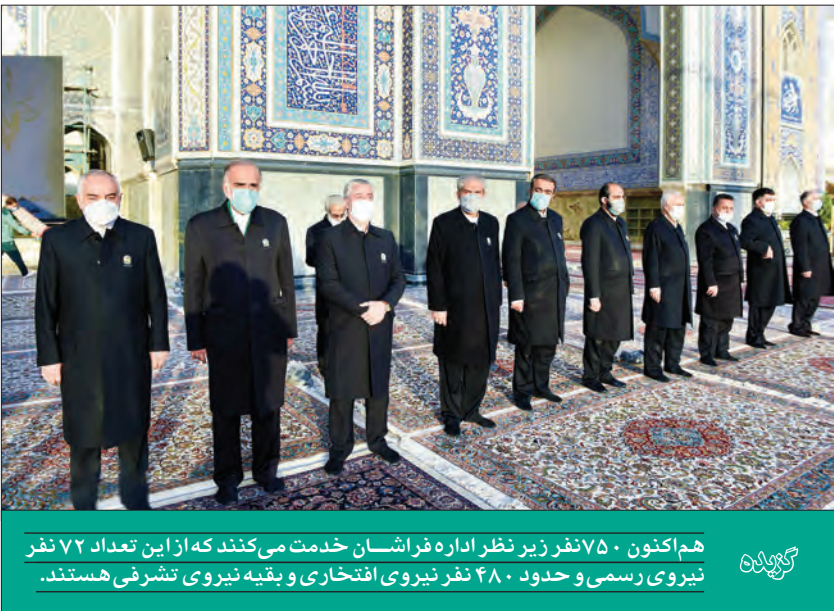
هم‌اکنون ۷۵۰ نفر زیر نظر اداره فراشان خدمت می‌کنند که از این تعداد ۷۲ نفر نیروی رسمی و حدود ۴۸۰ نفر نیروی افتخاری و بقیه نیروی تشریفی هستند.

■ خدمت‌رسانی منظم از دوران صفویه تاکنون فراشان، تحت‌نظراداره فراشان آستان خدمت می‌کنند؛ نهادهی با قدمت حدود ۴۰۰ سال که از مهم‌ترین بخش‌های حرم و در تعامل مداوم با زائران است و محمد قلندریان، رئیس این اداره درباره‌اش به ما می‌گوید: در وقف‌نامه‌هایی مثل طومار علیشاهی که از زمان صفویه به جای مانده ، اشاراتی به خادمان و فراشان حرم مطهر شده