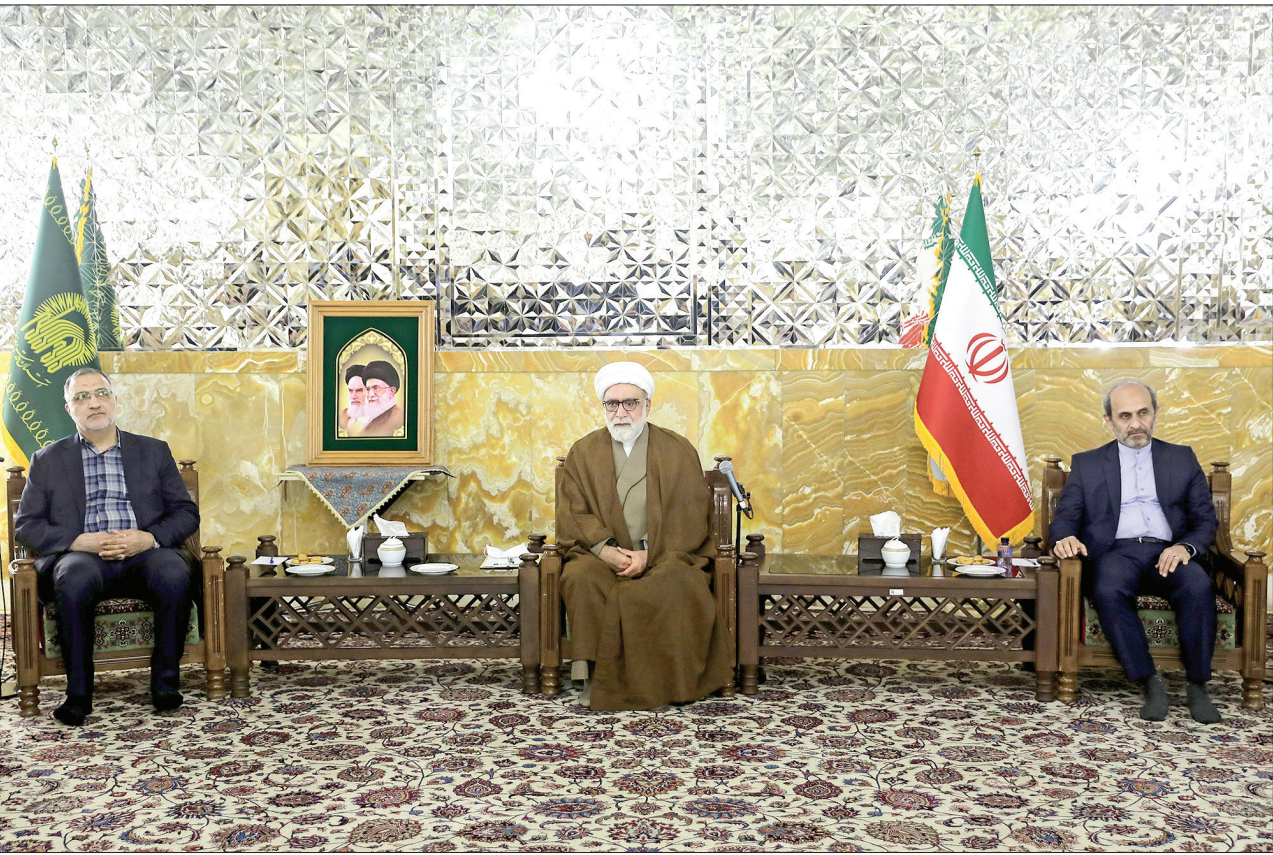
تولیت آستان قدس رضوی در دیدار با مدیران سیما

نشست مشترک رئیس رسانه ملی، شهردار تهران و معاونان کلانشهرهای کشور با تولیت آستان قدس رضوی درباره جشن های دهه کرامت