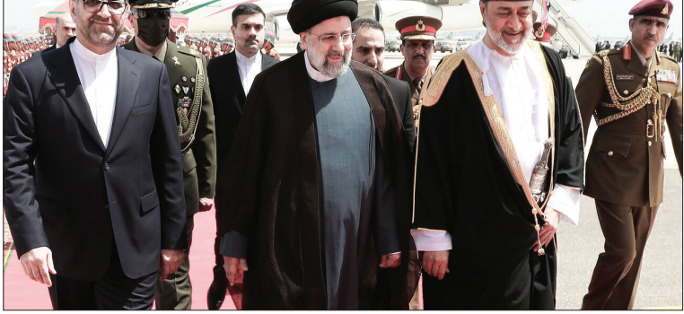
تصویر مربوط به سفر هیئت ائام‌الامم رسمی به عمان است

دیپلمات کشورمان از زندان دولت بلژیک، آن را به گونه‌ای پیش درآمد این سفر دانست، نعیمی اهداف احتمالی سفر هیشم بن طارق به تهران را متأثر از دیپلماسی «عدم درز اطلاعات تا نتیجه دهی قطعی» دولت عمان عنوان کرد و پیش‌بینی کرد در این سفر احتمالاً پیام‌هایی مرتبط با پرونده‌های ایران و غرب تبادل خواهد شد؛ زیرا در گذشته نیز چنین بوده و عمان گزینه مورد اعتماد طرفین است به همین خاطر تلاش خواهد کرد تا موفقیت قطعی