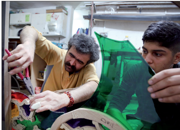
گره‌ها روی هم سوار می‌شوند تا ارسی‌ها را بسازند