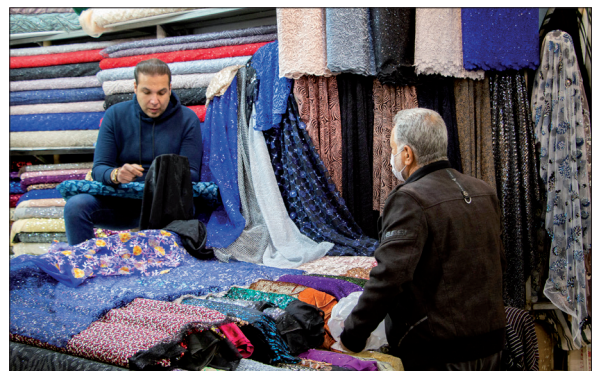
بازار تاریخی وکیل، هنوز هم بازار اصلی شیراز است

در میان این سرا یک حوض بزرگ هشت ضلعی خودنمایی می‌کند پر از ماهیان کوچک قرمز که در کنار آن گلدان‌های زیبای شمعدانی قرار دارد. در سمتی از این سرا ساختمانی زیبا و دوطبقه ساخته شده که با کاشی‌های شگفت‌انگیزی زینت یافته و حجره‌های طبقه پایین این ساختمان، صنایع دستی را برای ارائه به گردشگران به نمایش گذاشته‌اند. برای رفتن به طبقه بالای این ساختمان باید از پله‌هایی با شیب تند و ارتفاع زیاد عبور کرد. در طبقه بالای این ساختمان، هنرمندان قدیمی صنایع دستی که به طور عمده از استادان بنام شیرازی هستند، به کار مشغول‌اند.