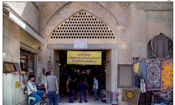
گذشت زمان نتوانسته رونق را از بازار وکیل دور کند