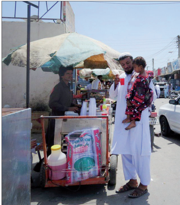
نوشیدنی‌های دست ساز، پر مشتری است