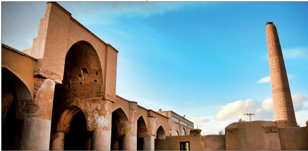
مناره مسجد تاریخانه به صورت خشت گلی چیده شده است