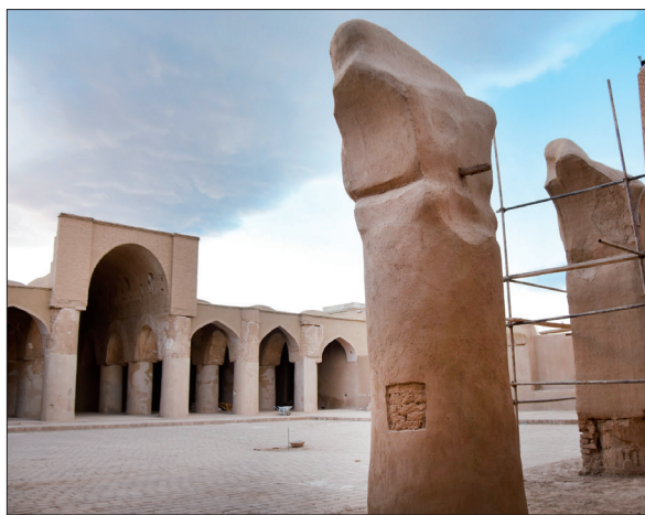
در چند سال گذشته برای مرمت و بازسازی تاریخانه اقداماتی انجام شده است

چند سال اخیر به همت و تلاش اداره میراث شهرستان دامغان اعتبار خوبی برای مرمت و بازسازی این بنای تاریخی اختصاص داده شده است، اما دو ستون آن سالیان متمادی است که شکست خورده و توسط ستون‌های چوبی مهار شده است