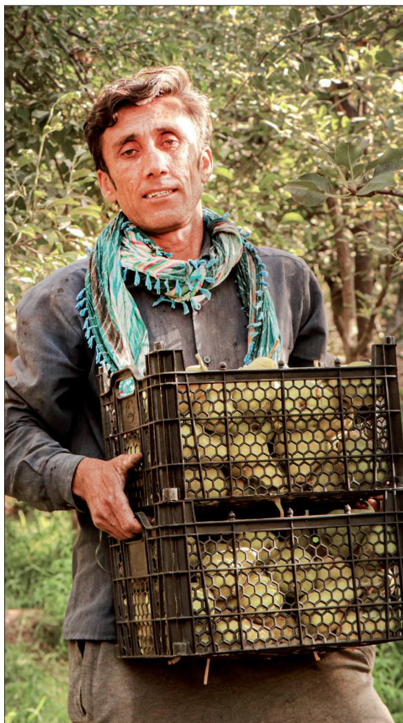
گلابی‌های رسیده، در سبدهای پلاستیکی جمع‌آوری می‌شوند تا بسته‌بندی شوند

برای کشت نهال، زمین در نظر گرفته شده را یک متر گودبرداری می‌کنند و نهال‌هایی را که حالا یک ساله شده‌اند در آن می‌کارند. سال نخست اطراف نهال‌ها چغندر دامی کشت می‌شده که برای خوراک دام‌ها استفاده شود.