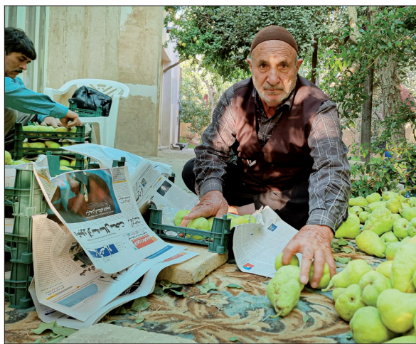
روزنامه‌های باطله، همچنان به کار کشاورزها می‌آیند

تعدادی از کارگران با چوب‌های توری‌دار مشغول جمع کردن میوه‌ها از درختان هستند. تعدادی هم از پای درختان، میوه‌های ریخته شده را جمع می‌کنند. پسران خانواده نیز با دقت گلابی‌ها را لای روزنامه در سبدها می‌چینند. عصر سبدهای گلابی بار ماشین می‌شوند تا صبح اول وقت به میدان‌های میوه در شهرهای دیگر برسند و تر و تازه میهمان خانه مردم شوند.