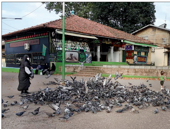
کبوترهای بقعه، به کبوترهای آسیدحسینی معروف هستند