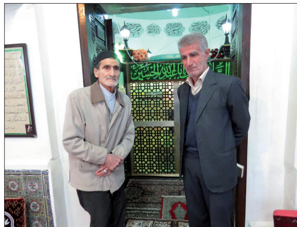
بقعه امامزاده، یک بنای قاجاری است که البته مرمت هم شده است نقاشی‌های ایوان بقعه، اثر «آقاخان نقاش لاهیجانی» از دوره قاجار