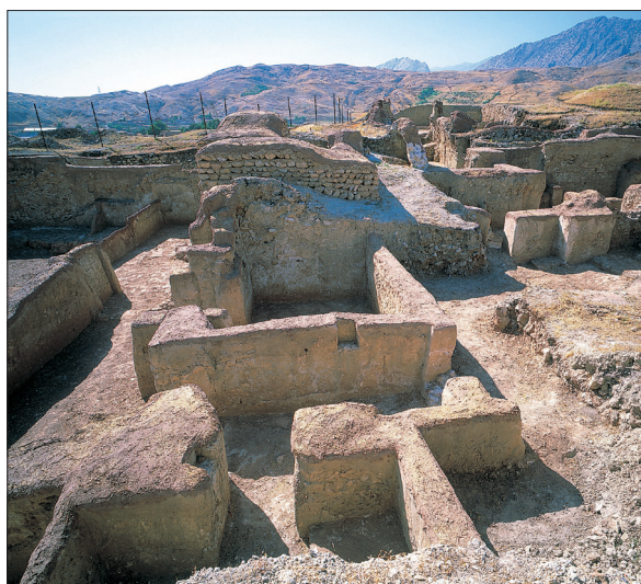
بقایایی از شهر تاریخی سیمره یا همان ماداکتو