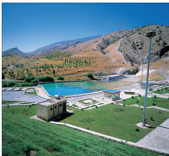
سراب دره شهر