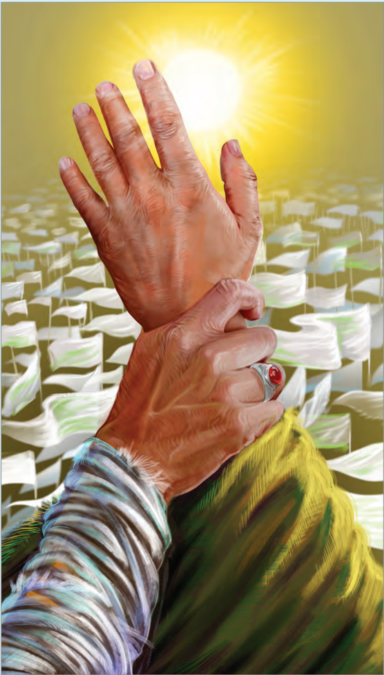
کارگاه گرافیک قدس