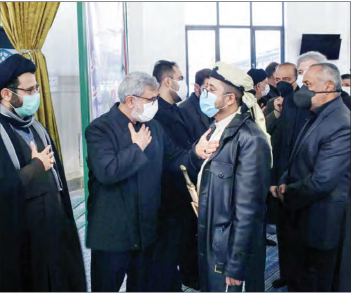
حضور سردار قانی در مراسم تشییع شهید حسن ایرلو