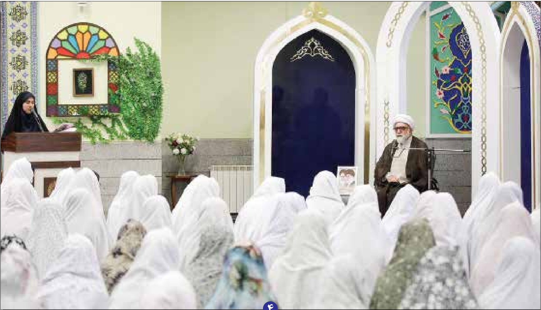
محمدچادر مشهدی - عکس رضوی

تولیت آستان قدس رضوی در دبیرستان امام رضا(ع) حضور یافت