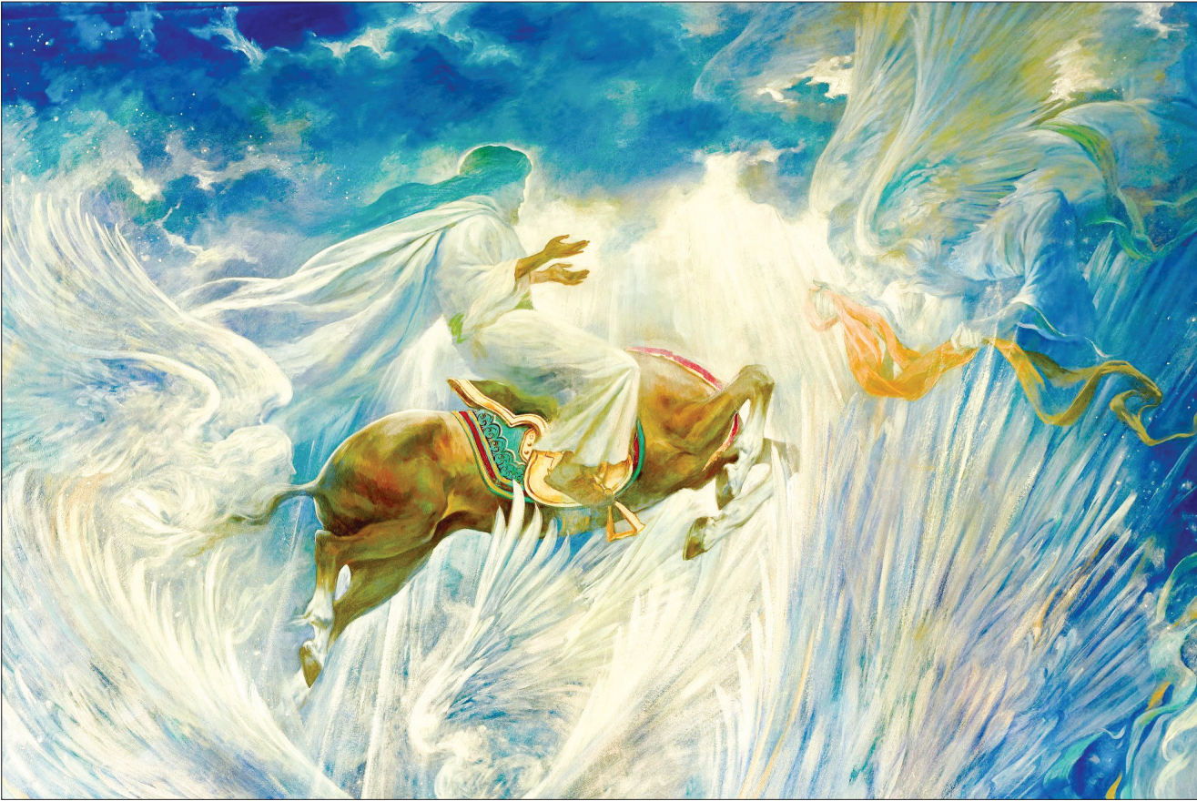
محمد رسول الله (ص) - اثر حسن روح‌الدین

روایت ولادت و روزهای آغازین حیات مبارک حضرت ختمی مرتبت