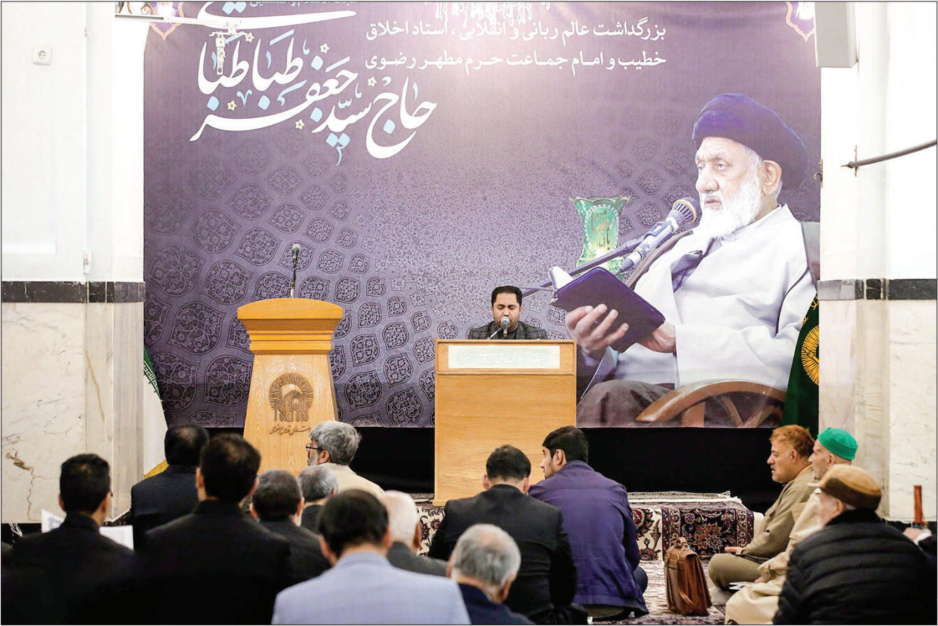
محمدجواد شهبازی - عکاس رضوی