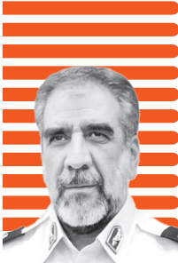
سردار عباسعلی محمدیان، فرمانده انتظامی تهران