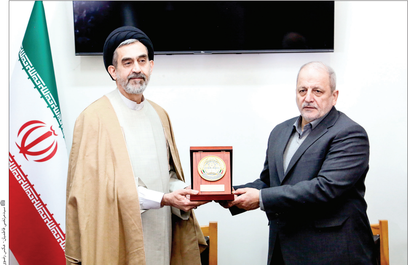
سیدمرتضی فاطمیان - عکاس رضوی