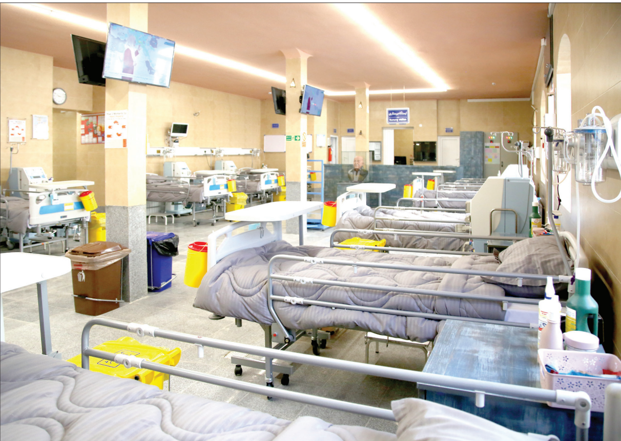
عقل اکبر شیشه‌چی