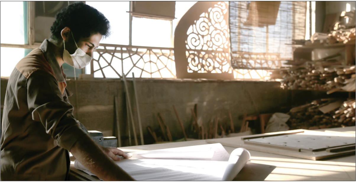
مدیرعامل شرکت آرایه‌های معماری رضوی

مترمربع درب و پنجره سنتی ساخته و به کربلای معلی ارسال شود.